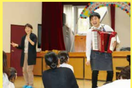
楽器や身の回りものを使って、音のイメージを想像してみよう。