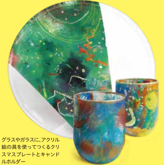
グラスやガラスに、アクリル絵の具を使ってつくるクリスマスプレートとキャンドルホルダー