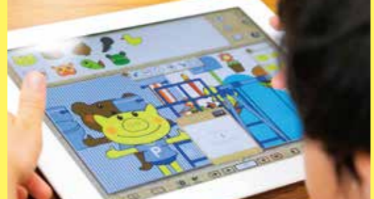
iPadを使って、デジタル絵本をつくります。

◎事前申込制(定員に達していない場合、当日参加可) ◎制作した紙の絵本はお持ち帰りいただけます。